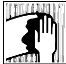
Gebruik papier of doeken